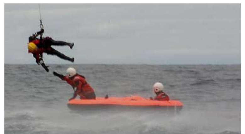
Neyðarsendar með innbyggðum gps-staðsetningarbúnaði gerir það að verkum að fyrr er hægt að koma mönnum til bjargar.

Landhelgisgæslan kallaði í bátinn án árangurs og kallaði einnig til báta á svæðinu. Auk þess var þyrlla gæslunnar kölluð út. Línubáturinn Núpur BA-69 var um 7 sjómílur frá staðnum og höfðu skipverjar séð reyk- og neyðarblysi