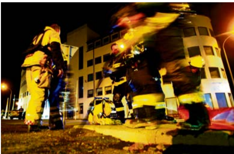
Mikilvægt er að fólk komi sér sem fyrst út úr brennandi húsi.