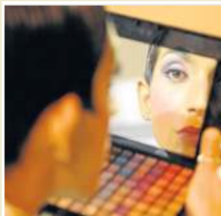
Espejo. Una herramienta fundamental.