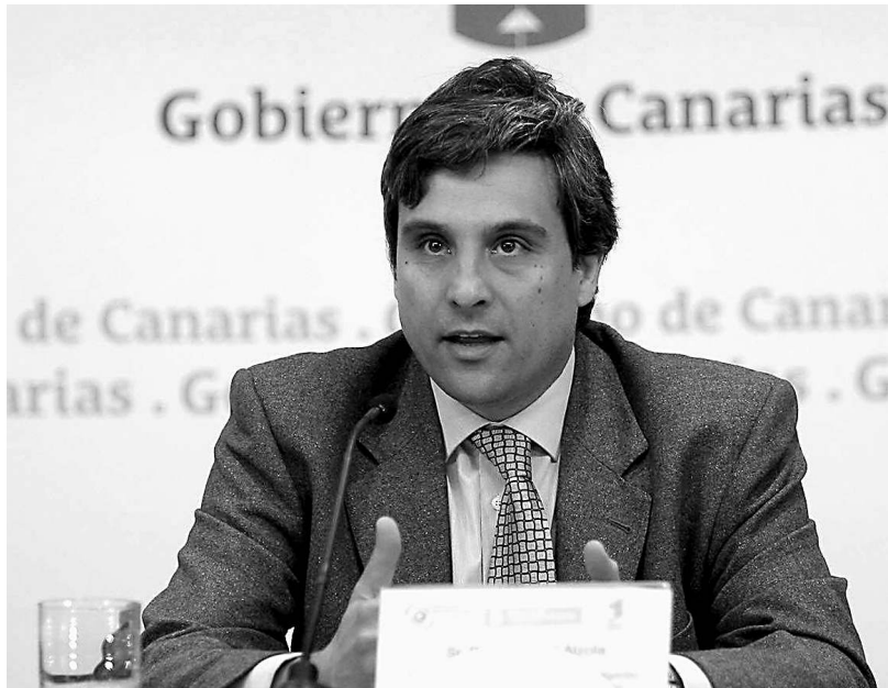
El director de la Agencia está convencido de que La Palma será la sede del telescopio.

A través de una nota, el departamento dirigido por Cristina Garmendia ha explicado que, aunque el modelo establecido es financiar al 50% con las comunidades autónomas este tipo de