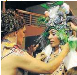
Preparados. Vísteme despacio, que tengo prisa.