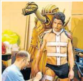
Decorado. Los cuerpos se ponen a punto.