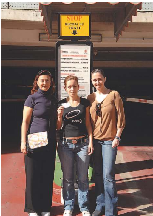
Varias madres afectadas frente al parquin el pasado jueves. | QUESADA

Navarro explicó que el parquin era gratuito tanto para las familias con niños ingresados como para los que acudían sólo por unas horas y que lo que se ha he-