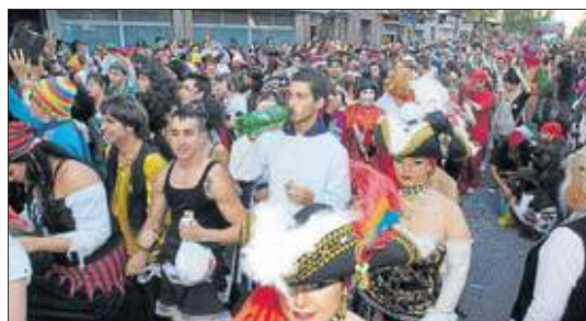
Piratas. Un momento de la gran cabalgata del año pasado.

Además así se vuelve a integrar al escenario en uno de los actos más multitudinarios de las carnestolendas de la capital. Como todos los años la gran cabalgata del sábado saldrá a las 17.00 horas desde la glorieta de Belén María.