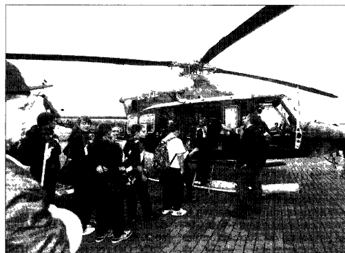
ÁNGEL MEDINA G. (EFE)

Durante la celebración del Día Europeo del 1-1-2, en Las Palmas de Gran Canaria, primera