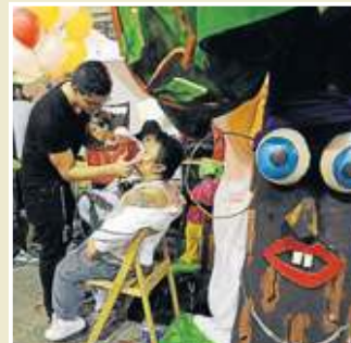
Ambiente. Calor y emoción en las horas previas.