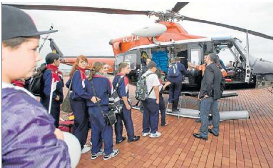
Actividades. El día del 1-1-2 permitió a escolares grancanarios conocer de cerca los dispositivos de emergencias de las islas.

Tres de cada cuatro europeos desconoce «todavía» la existencia del teléfono 1-1-2 tras casi veinte años en funcionamiento. Así lo manifestó ayer la vicepresidente del Parlamento europeo, Diana Wallis, en un mensaje de vídeo emitido durante la celebración del Día Europeo del 112 en Las Palmas de Gran Canaria, primera sede española para la conmemoración oficial de este acto.