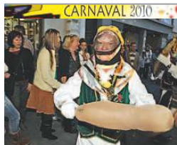
Un buche, ayer, en Arrecife.

El Cabildo mayorero rectifica y anuncia que el Plan Insular no dará autorización a nuevas camas turísticas