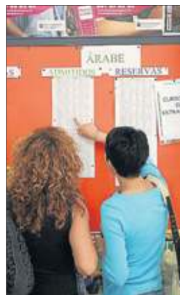
Alumnos en una escuela de idiomas.

Pérez también señaló que se mantendrán los exámenes de certificación en todas las escuelas de idiomas para este año, que se celebrarán entre el 5 y 15 de junio, previa inscripción en la primera quincena de mayo. La preinscripción y la matrícula se podrán realizar por internet.