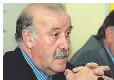
Del Bosque, ayer, en Las Palmas.

El seleccionador nacional incluye a Pedrito entre los candidatos a formar parte del equipo de España