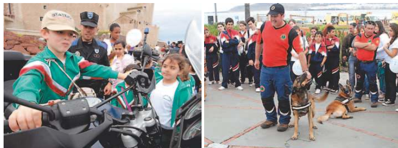
Arriba, escolares en un helicóptero del SUC. Abajo (izq.) un niño en una moto policial. A la derecha, perros de rescate.

Cientos de escolares de la Isla se dieron cita ayer en Las Canteras para comprobar in situ cómo trabajan los equipos de emergencia de la comunidad ante un accidente. El despliegue de fuerzas no decepcionó.