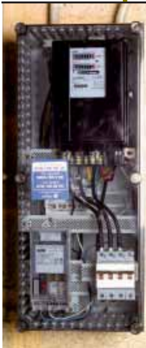
Changer de fournisseur peut se traduire par une économie substantielle.

C'est la conclusion qui s'impose, à l'issue de la comparaison que nous avons effectuée entre les différentes sociétés qui se disputent le marché flamand, le seul à être effectivement ouvert à la concurrence depuis le 1er juillet dernier.